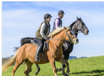
Pferde & Reiten