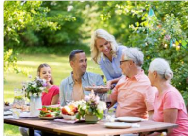
Genießen & Tagen